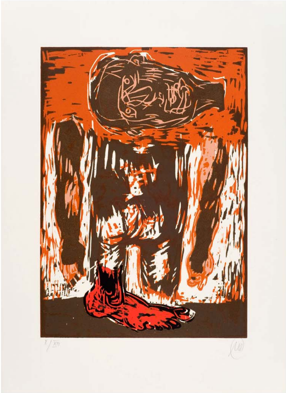
Markus Lüpertz Rückenakt mit rotem Fuß