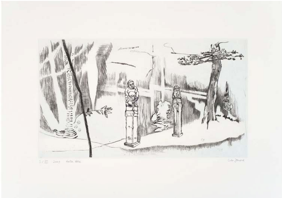
Udo Dzierk Halbe Höhe