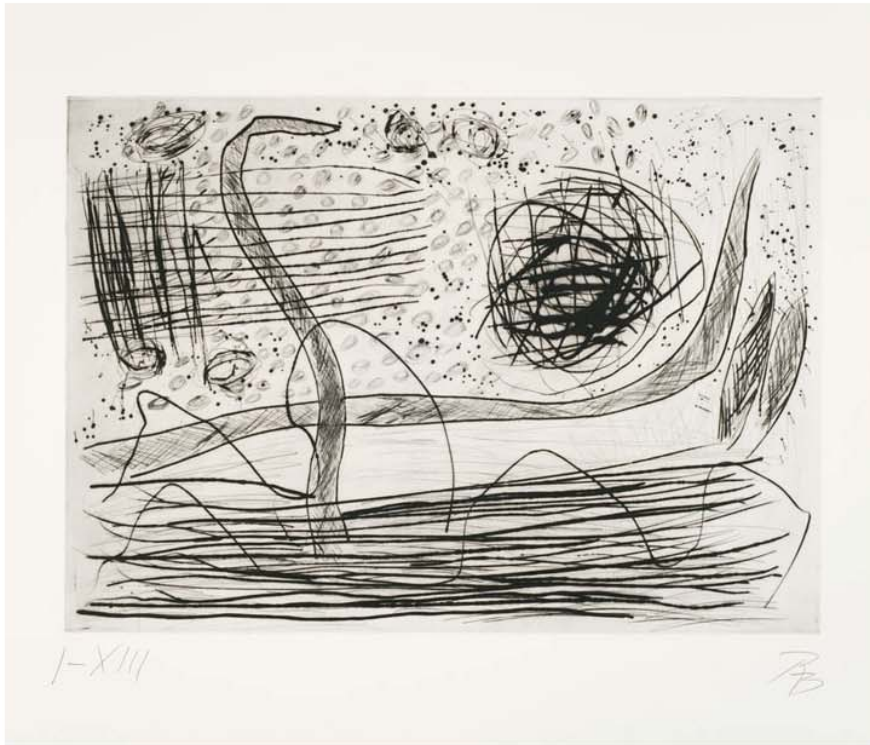
Reinhold Braun topos univers